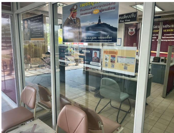
รูปถ่ายผลการดำเนินงานจริง ณ จุดบริการ ของสถานีตำรวจภูธรวิเชียรบุรี