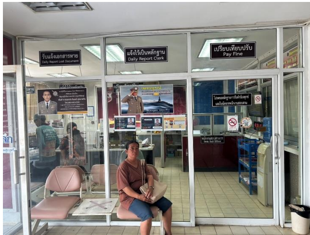
รูปถ่ายผลการดำเนินงานจริง ณ จุดบริการ ของสถานีตำรวจภูธรวิเชียรบุรี