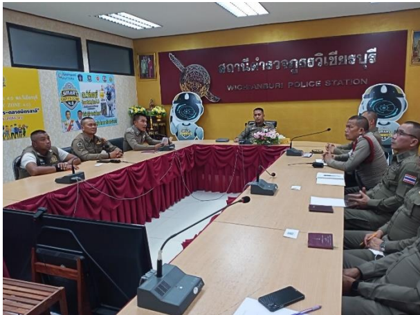
รูปถ่ายผลการดำเนินงานจริงของสถานีตำรวจภูธรวิเชียรบุรี