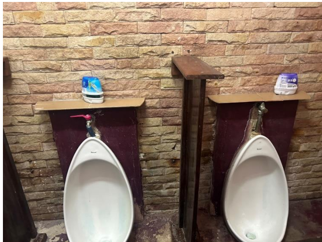
รูปถ่ายผลการดำเนินงานจริง ณ จุดบริการ ของสถานีตำรวจภูธรวิเชียรบุรี