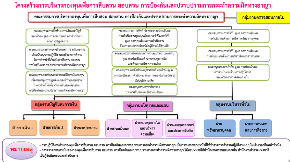
ภาพที่ ๑.๑ โครงสร้างการบริหารกองทุน

โครงสร้างกองทุนเพื่อการสืบสวน สอบสวน การป้องกันและปราบปรามการกระทำความผิดทางอาญา ดังภาพที่ ๑.๑